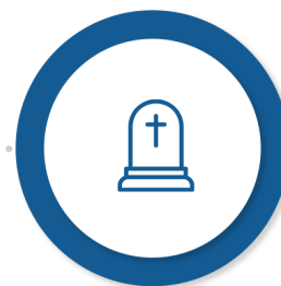
Ajutorul pentru înmormântare