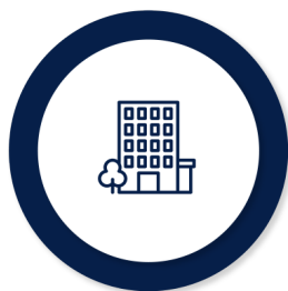
Asigurarea obligatorie pentru locuință

În funcție de nevoile familiei/persoanei singure, venitul minim de incluziune este însoțit de alte drepturi complementare, plătite de la bugetul de stat sau după caz, din bugetul local: