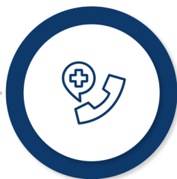
Ajutoarele de urgență (de la bugetul de stat și de la bugetul local)